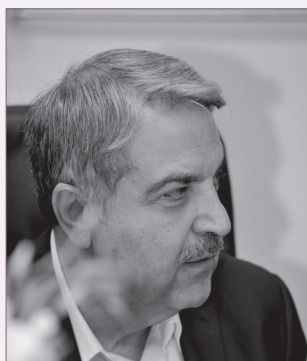
منصور شمس احمدی نایب رئیس شورای عالی انجمن حسابداران خبره ایران